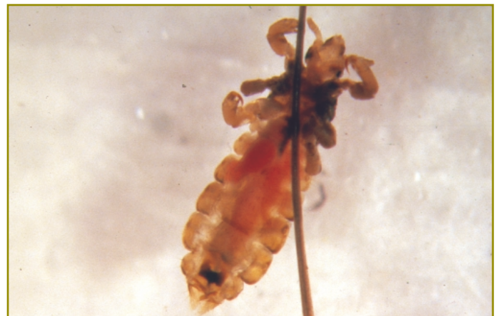
Figura 1. Piojo de la cabeza (El piojo del cuerpo tiene la misma apariencia.)

Los piojos de la cabeza prefieren vivir en el cabello de la cabeza y es poco frecuente encontrarlos en otras partes del cuerpo. Cuando ocurre una infestación grave, las secreciones que producen pueden causar que el cabello se apelmace. El ciclo de vida consta de tres etapas: huevo (liendre); ninfa, y adulto. La hembra oviposita entre 4 y 6 liendres al día, o entre 50 y 150 huevecillos durante su vida. Los huevecillos son de forma oval, de color canela claro y aproximadamente del tamaño de una partícula fina de arena. Las liendres se pegan a los tallos del pelo cerca del cuero cabelludo, usualmente cerca de las orejas y en la parte posterior de la cabeza.